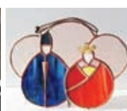
スタンドグラス おひなさま