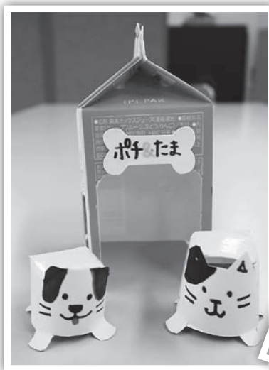
▲ポチ・たま in ハウス