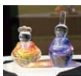
吹きガラス おひなさま