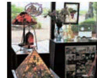
【坂祝町中央公民館】