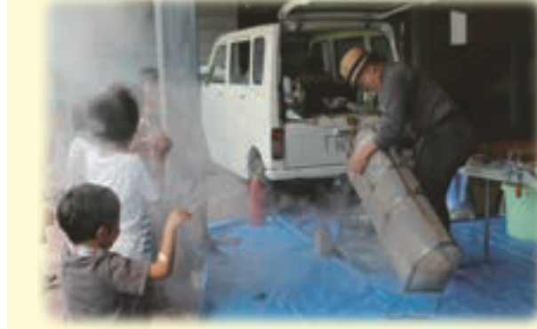
▲昔懐かしのボン菓子▲

ボン菓子・かき氷の無料サービス、ガラス製品が当たる抽選会など、催し盛りだくさんでした。