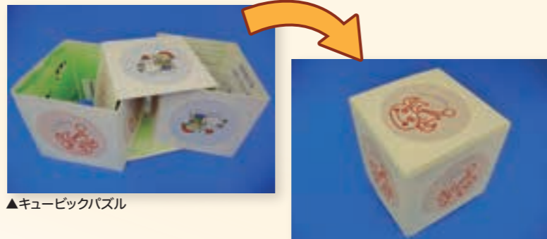
▲キュービックパズル