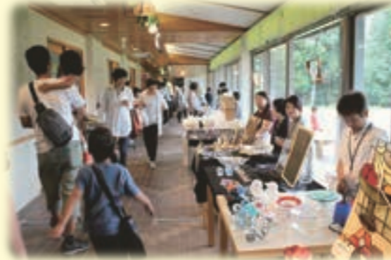
▲受講生のガラス作品市▲

割引券 わくわく体験館通常のガラス工芸体験が、5%割引になります。他の割引券との併用、複製(コピー)でのご利用はできません。1枚につき5名までご利用可能です。有効期限:平成30年6月30日(土)キリトリ線