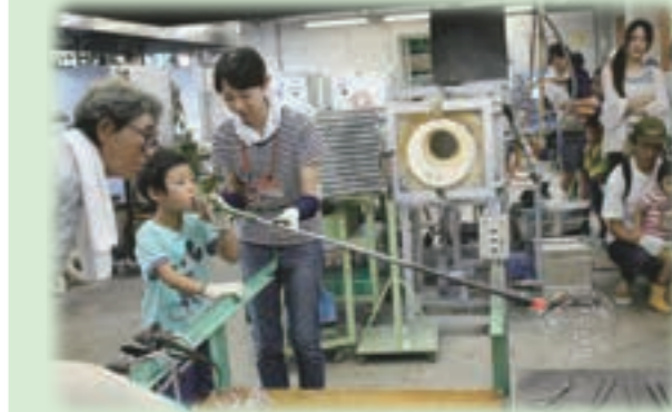
▲吹きガラスちょこっと体験▲

フリークラス受講生の作ったステンドグラス、吹きガラス、トンボ玉を、お値打ち価格で販売。