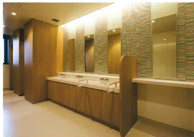
パウダーコーナーのある女性用トイレ