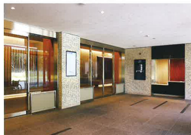
中央玄関には、わかりやすい案内表示（デジタルサイネージ）