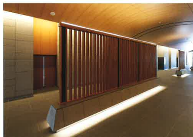
プライバシーに配慮し視線をコントロールする木格子のエントランス