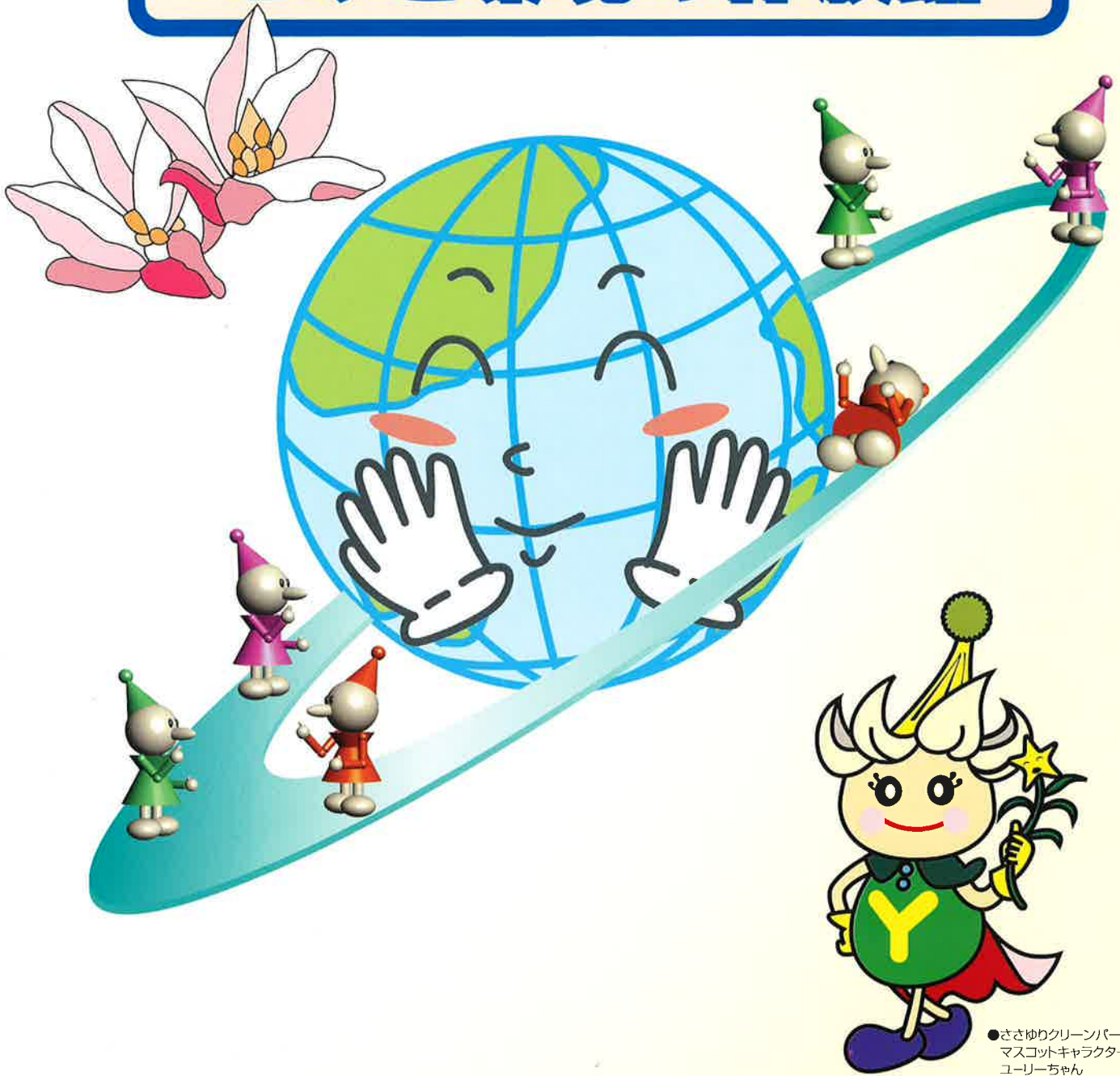
●ささゆりクリーンパーク マスコットキャラクター ユーリーちゃん