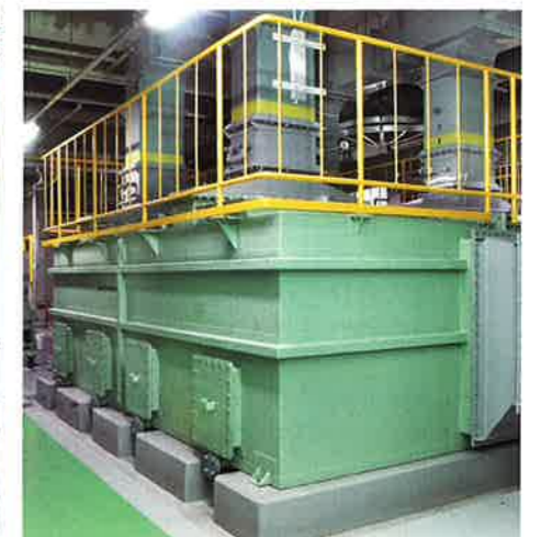
活性炭吸着塔(低濃度臭気)