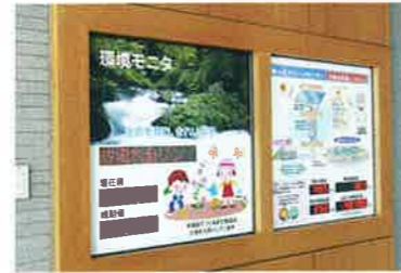
環境モニターと太陽光発電モニター