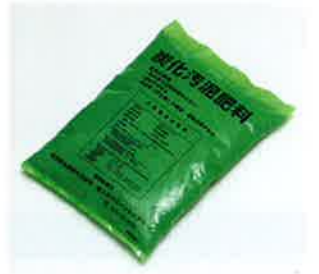
袋詰めした炭化物