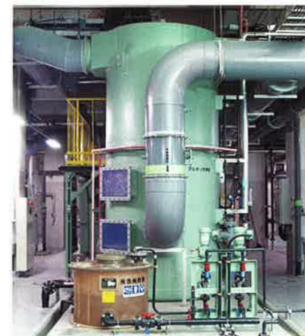
アルカリ洗浄塔(中濃度臭気)

施設で発生する臭気は、その発生箇所から直接吸引し、それぞれの成分に応じた効率のよい方法で脱臭処理し、外部はもちろん場内にも拡散しないようになっています。高濃度臭気は処理水槽に導いて生物脱臭処理します。中濃度臭気はセラミック方式によるアルカリ洗浄脱臭の後、活性炭吸着脱臭処理します。低濃度臭気は活性炭吸着脱臭処理します。