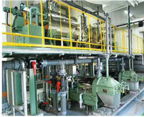
細目スクリーン・スクリーブレス