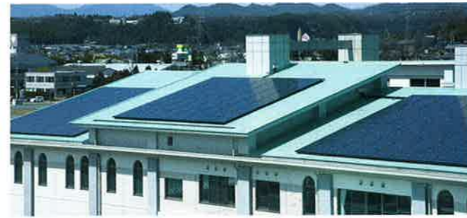
太陽光発電パネル