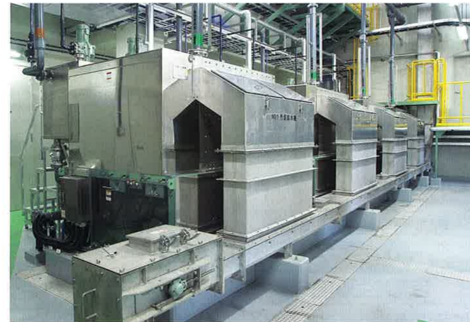
多重円盤型脱水機