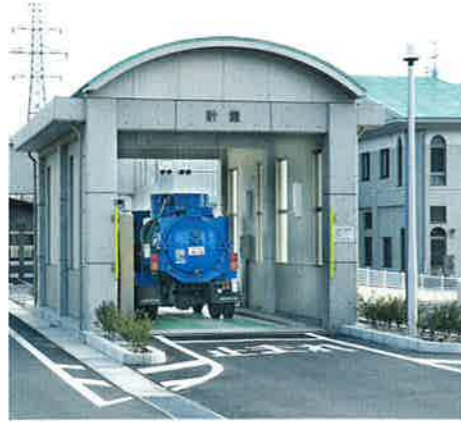
トラックスケール

搬入したし尿と浄化槽汚泥は、その量をトラックスケールで計量します。そして、それぞれの投入口から投入し、混入している石や砂を除去します。つぎに、紙・布・ビニールなどを細かく切断し、前処理設備で分離・脱水します。分離したし渣(紙・布など)は、焼却炉へ送ります。前処理後の浄化槽汚泥は水処理工程からの余剰汚泥とともに脱水処理します。脱水分離液は、し尿の前処理分離液とともに1次・2次処理設備へ送ります。なお、別途搬入された下水汚泥は、乾燥機へ直接送ります。